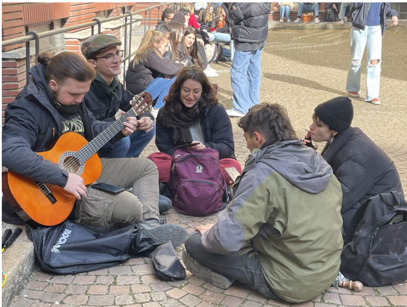
Studenti in cortile

meglio di ieri» mi dice ridendo, in un soffio di voce. Lei è una studentessa dell'ultimo anno e rappresentante del CAV, il Collettivo Autonomo Virgilio, che si è occupato di organizzare l'occupazione di tre giorni che oggi giungerà al termine. Per tutta la durata dell'occupazione, insieme ad un centinaio di altri studenti, ha dormito in un sacco a pelo all'interno della scuola. Non appena varcata la soglia dell'ingresso, un brusio di voci e di musica spezza il silenzio di poco prima. L'interno del liceo Virgilio brulica di vita: gruppi di studenti si affrettano su e giù per i corridoi, altri sono ancora chiusi all'interno delle aule dove si svolgono i laboratori. Un grosso tabellone, all'ingresso, mappa le attività che si sono tenute nel corso della giornata. «Stamattina si chiudono le ultime attività e i laboratori, poi dobbiamo pulire tutto ed essere fuori entro oggi pomeriggio» mi dice Isabella, spiegandomi le ragioni di quel gran fermento.