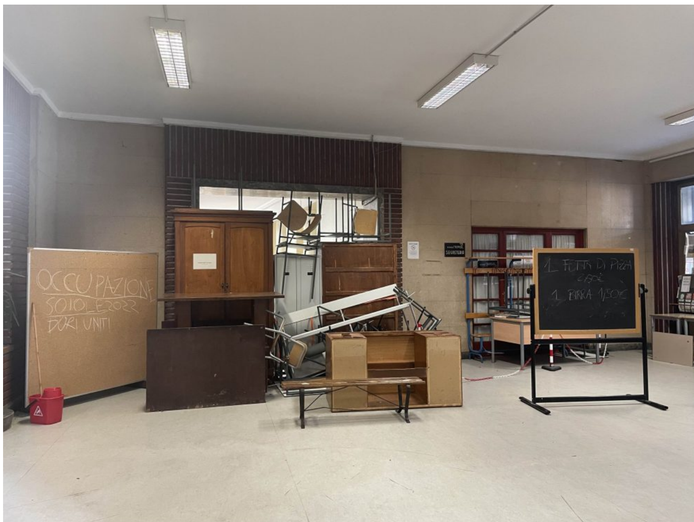
Le barriere costruite dagli studenti