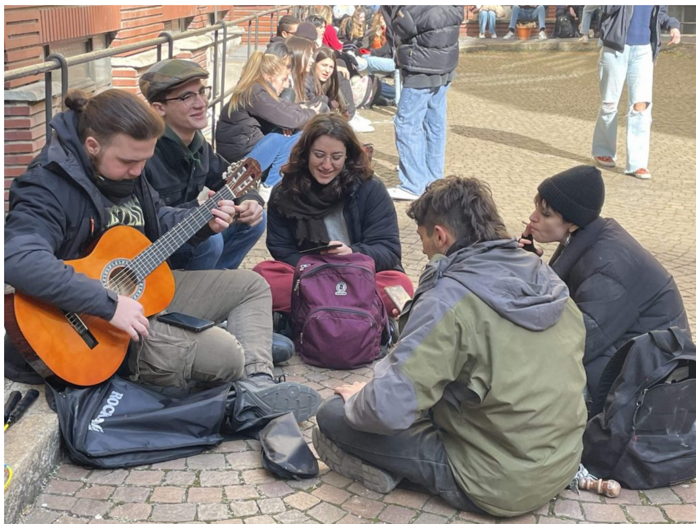
Studenti in cortile