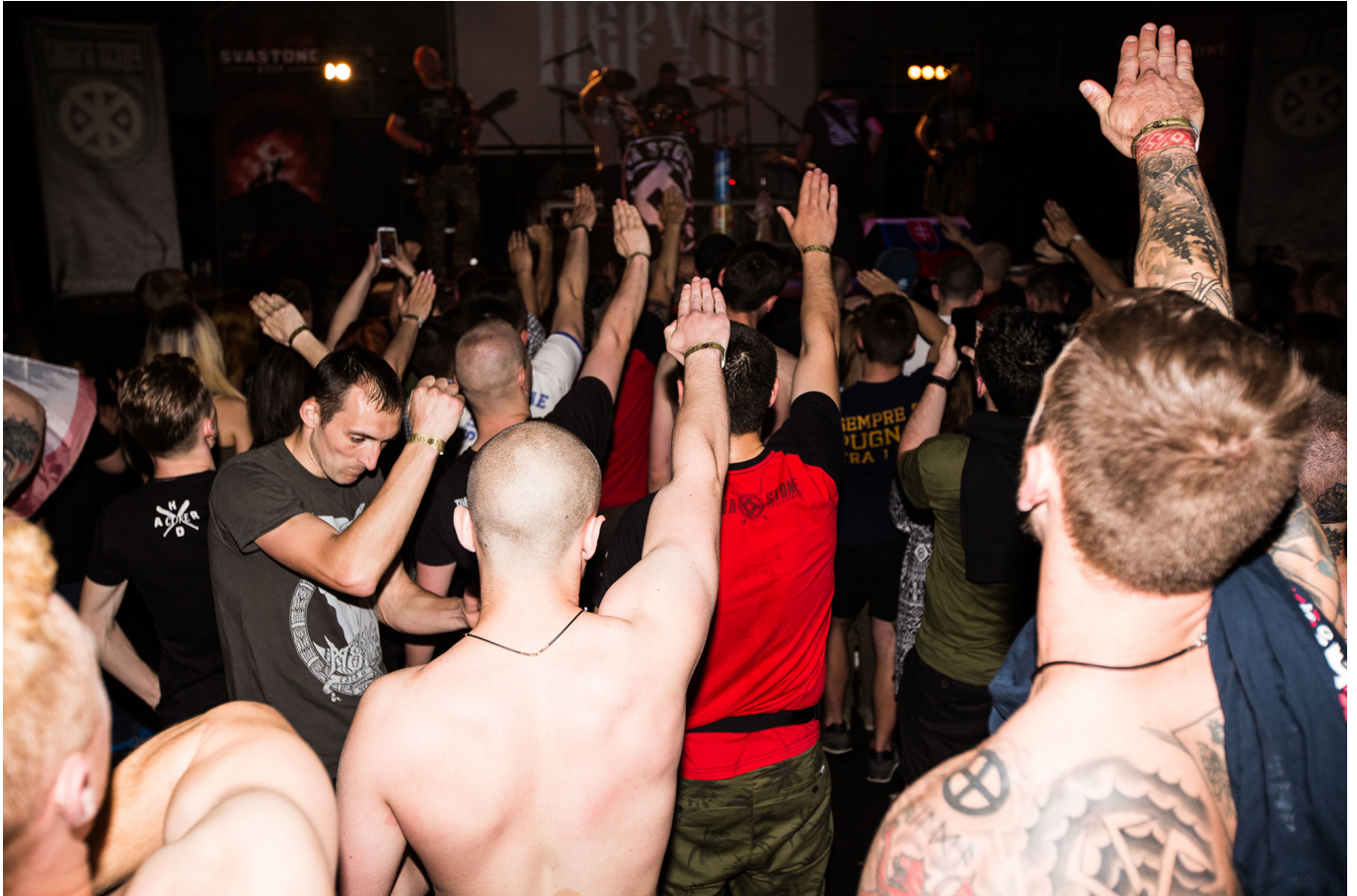
concerto della band Sokyra Peruna