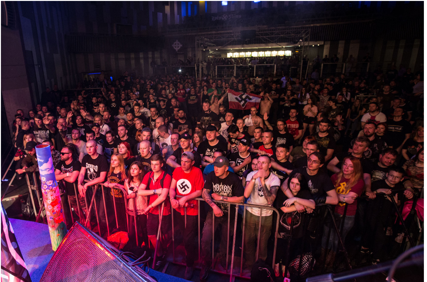
concerto della band Sokyra Peruna

sopracitata band Sokyra Peruna. Nel repertorio di questo gruppo musicale neonazista si trovano canzoni che negano l'olocausto come "Six Million Words of Lies" ("Sei milioni di parole di bugie").