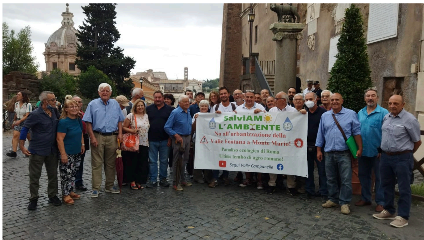
Comitato orti Valle Campanelle

Un'ulteriore vicenda nella quale sono i cittadini ad agire realmente per il bene del territorio contro progetti che promettono di salvare e invece sono pronti a devastare. Per difendere Valle Fontana , uno dei pochi lembi di campagna superstiti all'interno di Roma, è stato creato un Comitato col fine di scongiurare un "Dichiarato disastro ambientale". Una storia di povertà politica e ricchezza sociale che merita di essere portata alla luce, rinnovata testimonianza di come una cittadinanza consapevole, unita e organizzata rappresenti l'ancora di salvataggio per territori depredati da speculazione e malagestione. Per ben sette anni è stato portato avanti un progetto esecutivo per la "Riqualificazione ambientale e valorizzazione naturalistica" dell'area di Valle Fontana, zona nord-ovest della capitale, il quale al momento dell'effettiva messa in pratica ha subito una silenziosa metamorfosi . Così un'area verde di 33 ettari finora lontana dalla speculazione edilizia, sede da oltre 60 anni di uno dei primi orti urbani della città di Roma dove i circa trecento artisti contribuiscono al mantenimento dell'equilibrio nella valle di sughere centenarie, in cui si trovano importanti specie animali e vegetali, rischia di essere annientata.