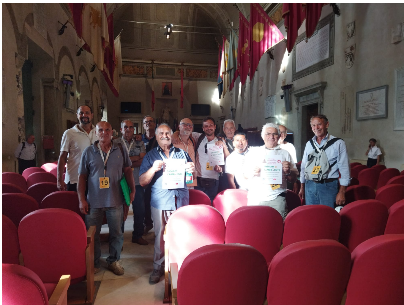
Il Comitato orti Villa Campanelle

Anche grazie all'azione del Municipio la battaglia del Comitato continua finché essi non saranno certi di poter salvare Valle Fontana, mentre la Città Metropolitana ha recentemente proposto un "compromesso" , quello di iniziare i lavori per non perdere i fondi, promettendo che poi ci saranno interventi per "Mitigare l'impatto", solo ad opera realizzata, racconta Pirandola.