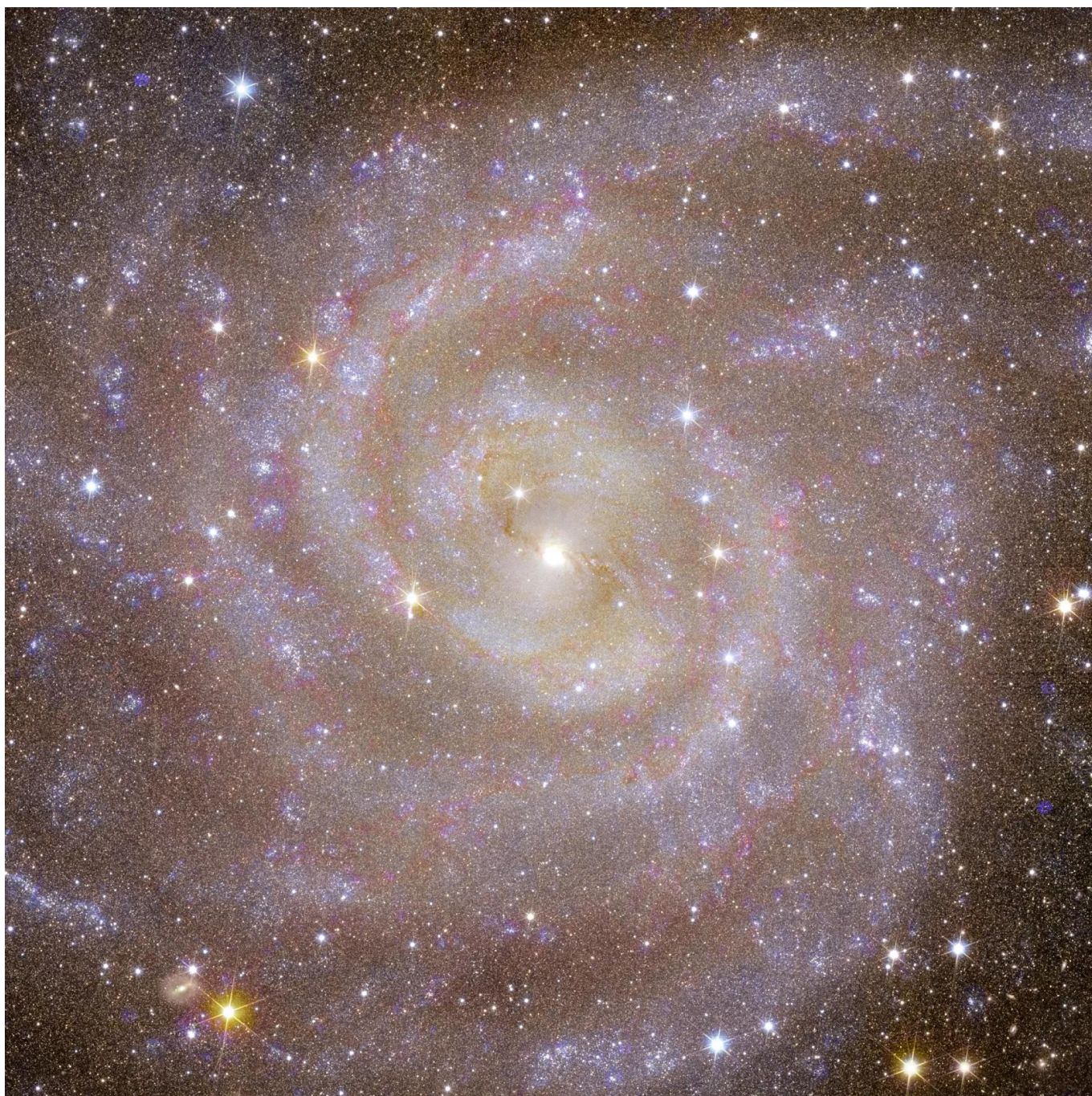
La galassia a spirale IC 342, conosciuta come la "Galassia Nascosta", che è simile alla Via Lattea

L'ESA rivela le prime straordinarie immagini del telescopio Euclid