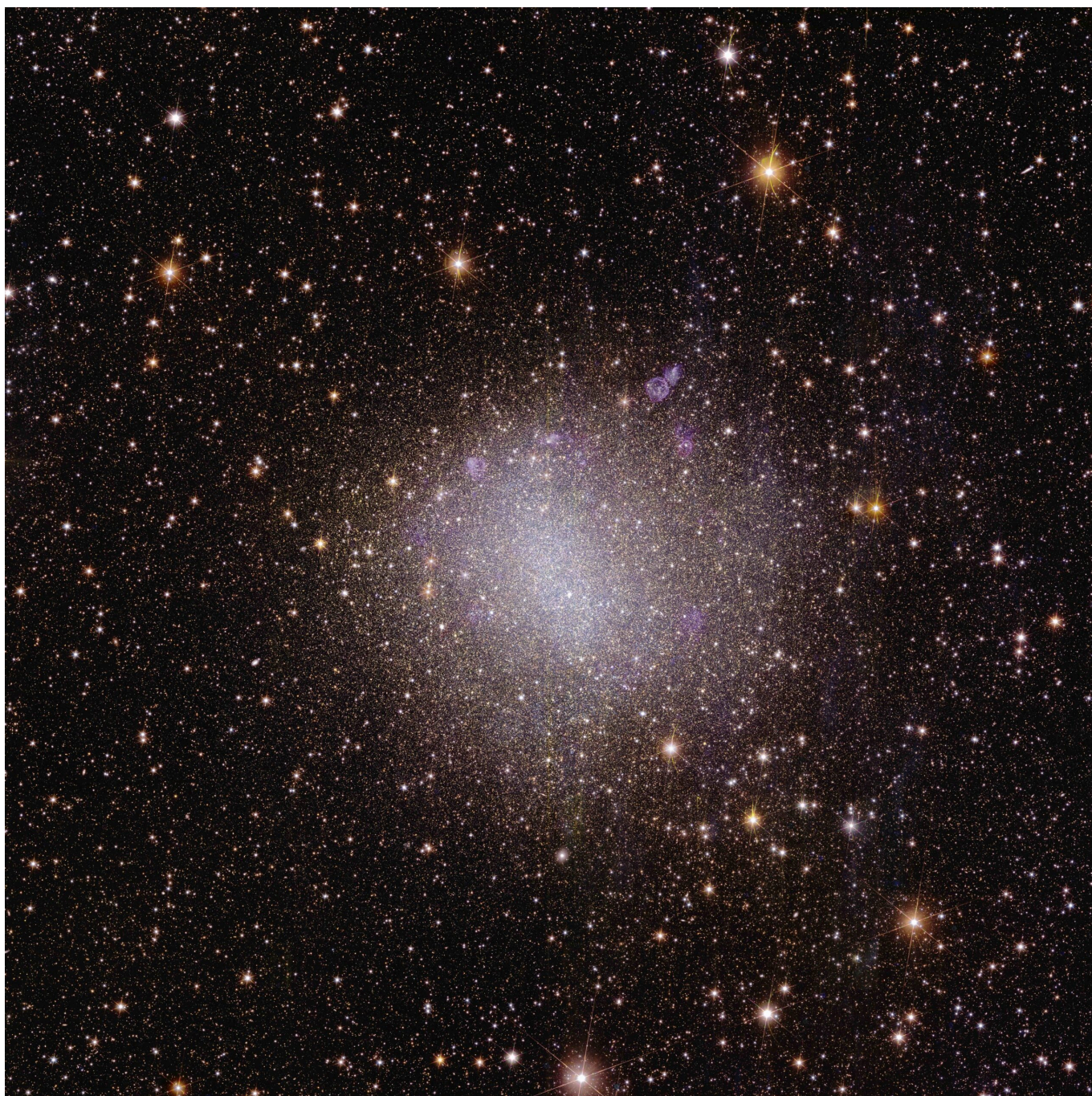
La prima galassia nana irregolare osservata da Euclid, NGC 6822. Si trova nelle vicinanze, a soli 1,6 milioni di anni luce dalla Terra

L'ESA rivela le prime straordinarie immagini del telescopio Euclid