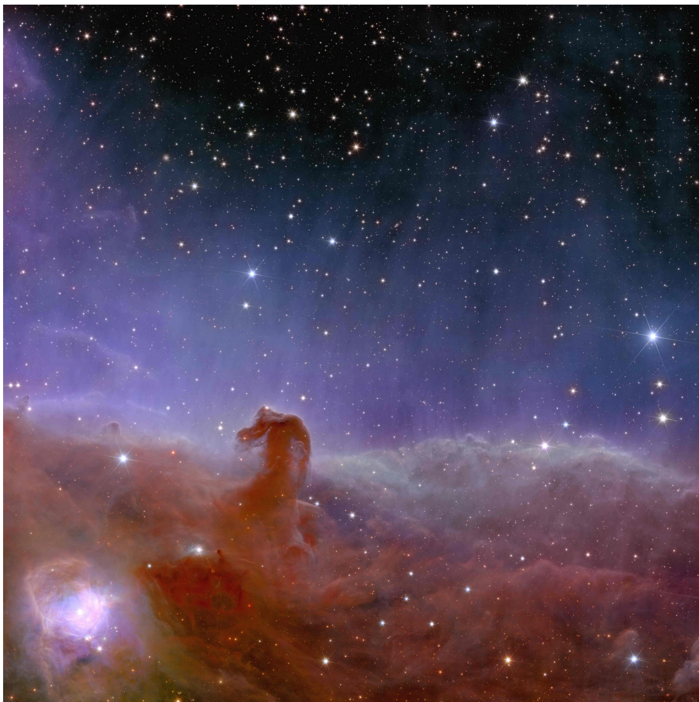
Vista panoramica e dettagliata della Nebulosa Testa di Cavallo, conosciuta anche come Barnard 33 e parte della costellazione di Orione

L'ESA rivela le prime straordinarie immagini del telescopio Euclid