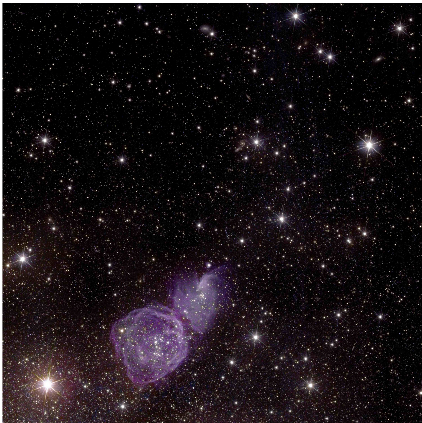
Un'altra immagine di NGC 6822

L'ESA rivela le prime straordinarie immagini del telescopio Euclid