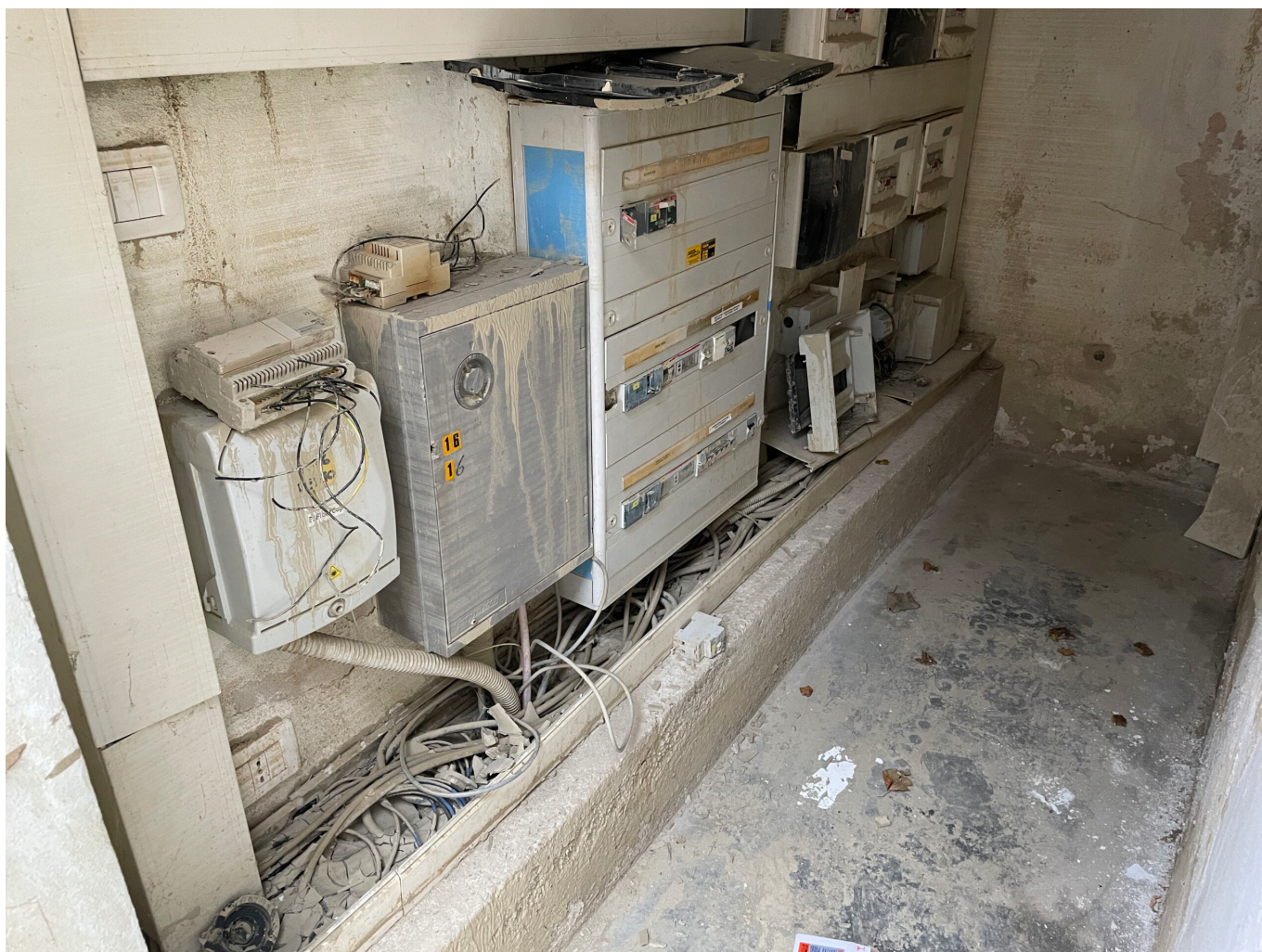
Il locale contatori, con i cavi completamente sommersi dal fango secco