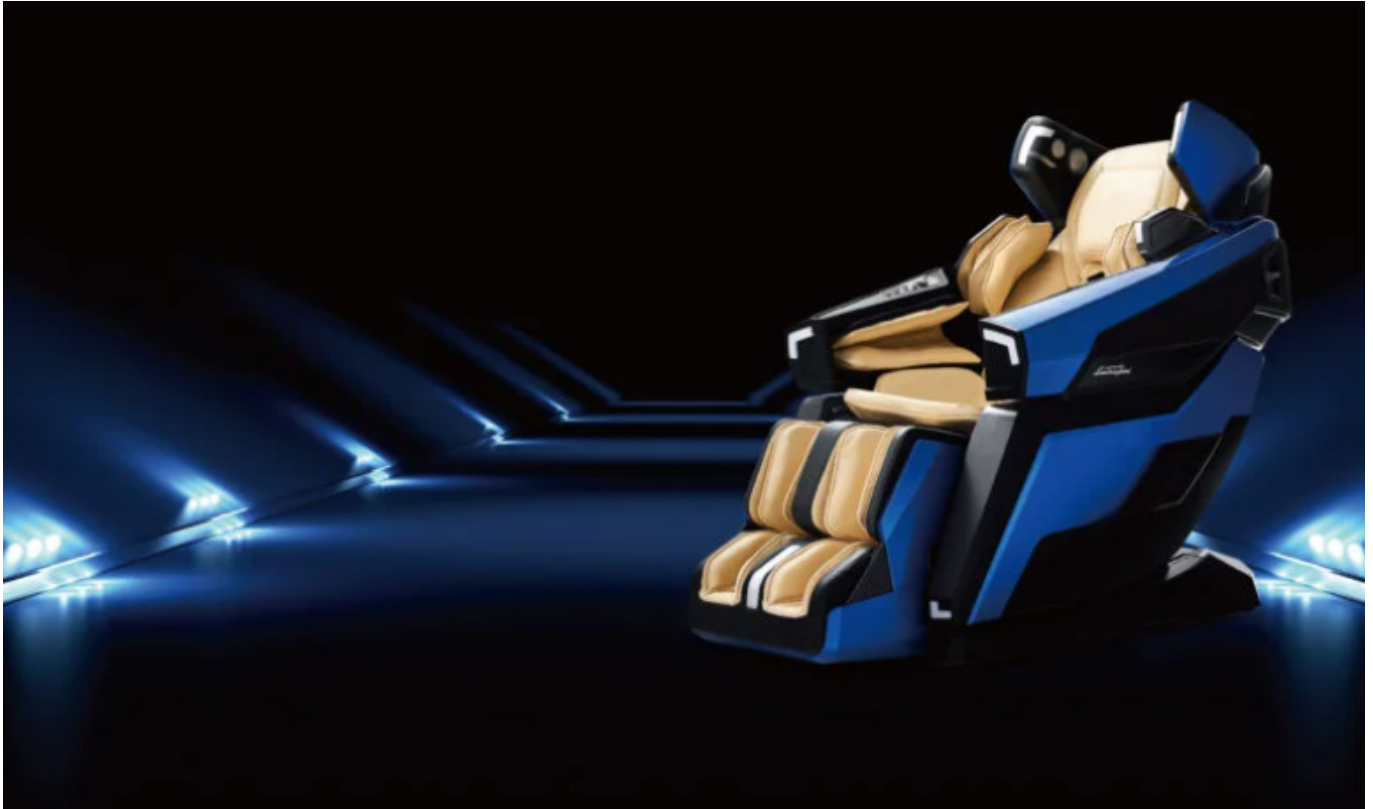
La poltrona bodyfriend lamborghini lbf-750

Come spendono tutti i loro soldi i super ricchi?