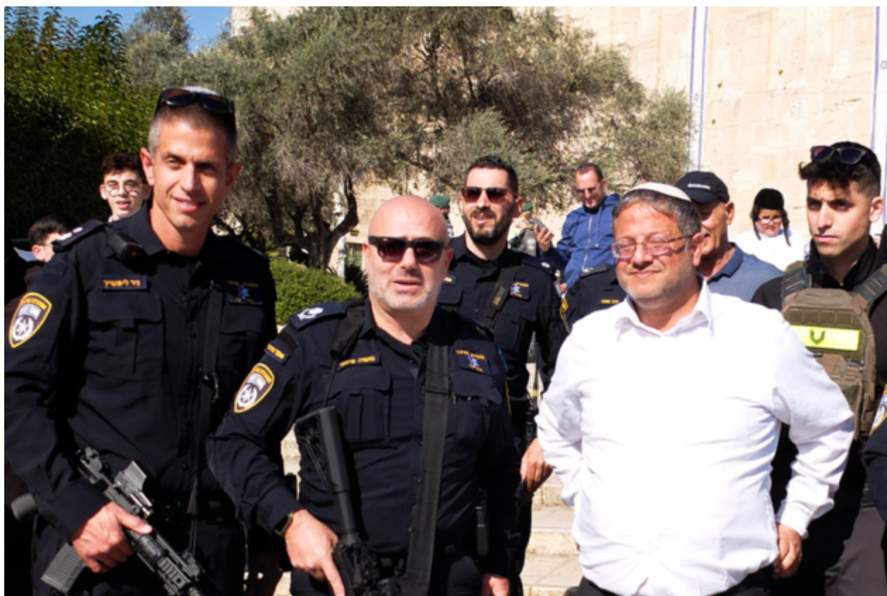
Itamar Ben-Gvir, leader del partito israeliano di estrema destra Otzma Yehudit e Ministro della sicurezza nazionale