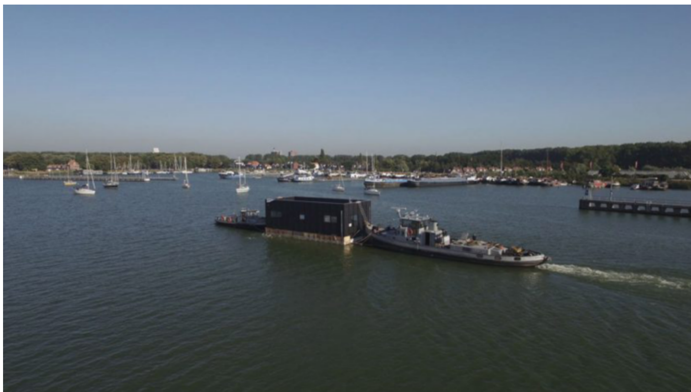
Trasporto dell'abitazione galleggiante di Taminiau