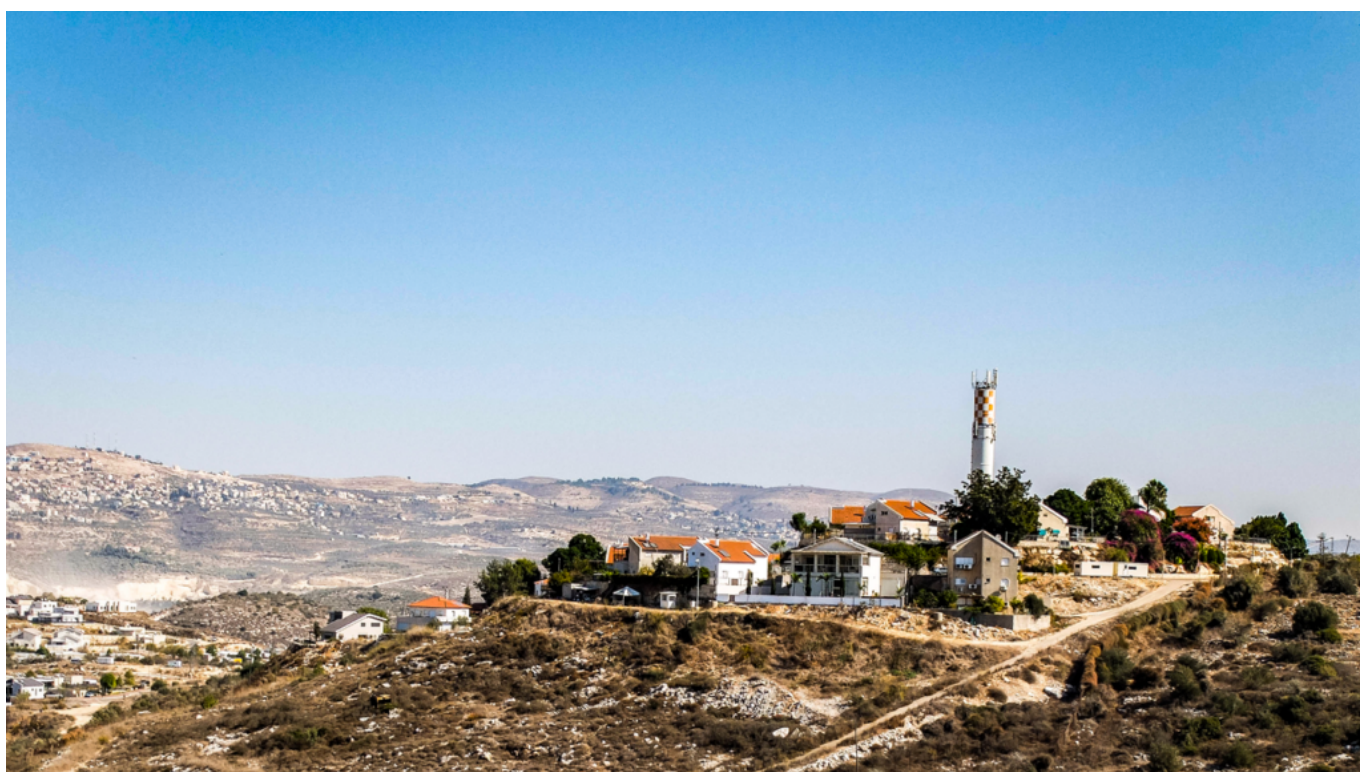
La colonia israeliana Einav

Beit Lid, zona nord della Cisgiordania occupata - «L'annessione totale della Palestina sarà presto realtà se la comunità internazionale non fa nulla e gli occidentali continueranno a finanziare Israele», mi dice R. mentre guardiamo il nuovo avamposto militare che i soldati israeliani hanno costruito a Beit Lid. Una richiesta, un grido silenzioso che risuona sempre più chiaro da nord a sud della Cisgiordania, dove Israele sta portando avanti una vera e propria guerra di annessione coloniale, fatta di confische di terre, distruzione di case, attacchi ai civili e alimentata dal fiume di denaro speso per finanziare e far funzionare le colonie illegali. «Dal 7 ottobre, mentre tutti gli occhi sono puntati su Gaza, dove stanno distruggendo tutto, gli israeliani si sono impossessati del più alto numero di terre di sempre qui in Cisgiordania. In un anno hanno dichiarato come "terre israeliane" più terre che negli ultimi 30 anni». Non mente R., sono dati rilevati dall'organizzazione palestinese Wall and Settlement Resistance Commission : solo nell'ultimo anno Israele si è annesso illegalmente 5.200 ettari di territorio che le leggi internazionali assegnano a quello che dovrebbe essere lo Stato di Palestina.