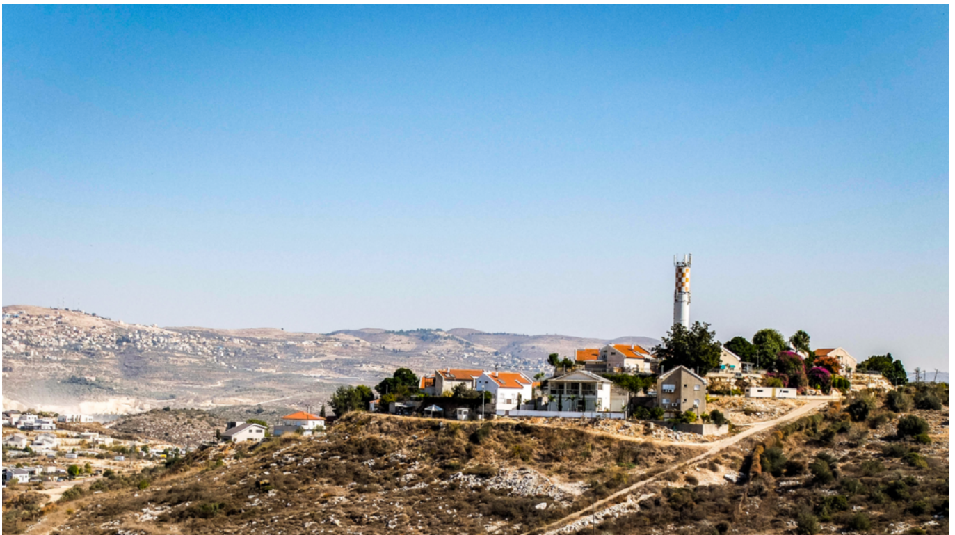
La colonia israeliana Einav