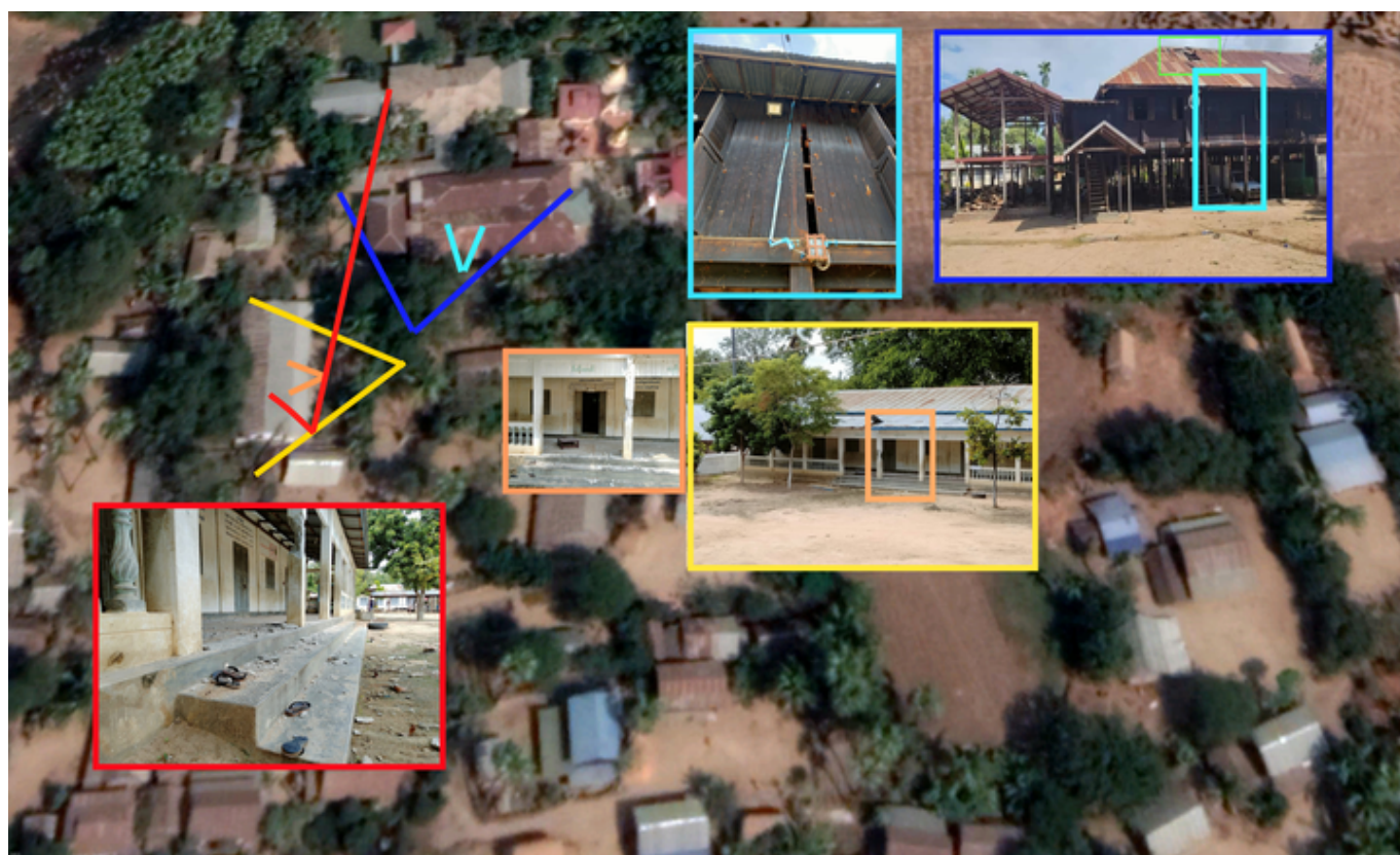
Geolocalizzazioni delle strutture nel villaggio di Let Yet Kone

Le strutture sanitarie subiscono un destino simile. Il 23 febbraio 2023, l' ospedale distrettuale di Ma Le Thar , nel Distretto di Ayadaw, viene distrutto da un attacco aereo seguito da un’incursione terrestre. Le immagini satellitari raccolte da MW confermano la distruzione dell’edificio, con crateri evidenti compatibili con esplosioni aeree. Testimonianze locali, sebbene difficili da verificare per via delle restrizioni circa l’attività dei giornalisti nel Paese, riportano saccheggi e la distruzione intenzionale di attrezzature mediche. Fonti anonime riferiscono di violenze fisiche contro pazienti e personale sanitario, inclusa la presunta decapitazione di alcuni civili , ma l’assenza di prove dirette rende impossibile confermare tali episodi.