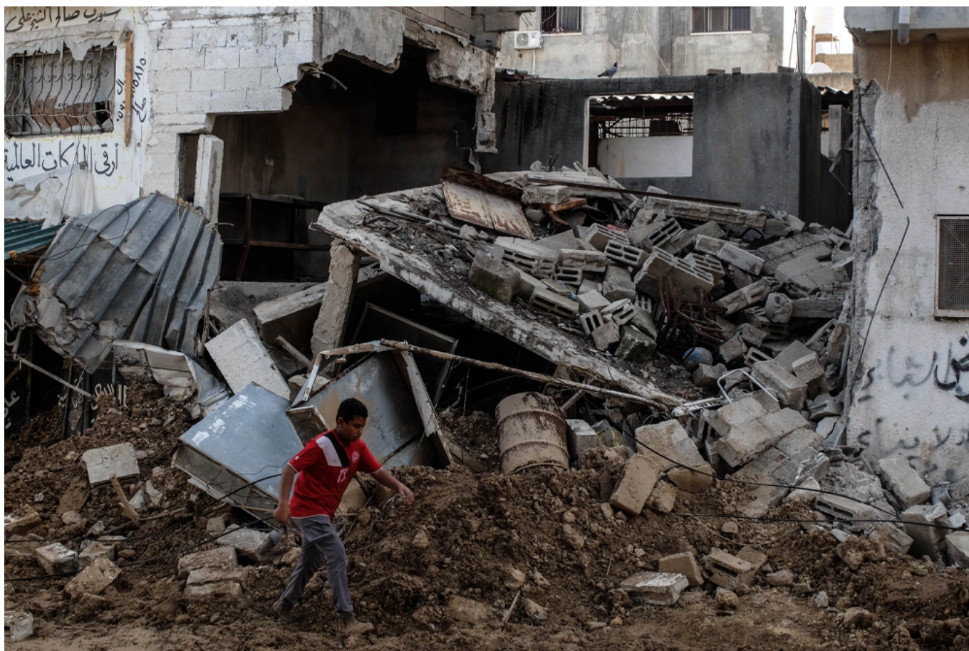
Abitazioni dalle bombe israeliane, campo profughi di Tulkarem