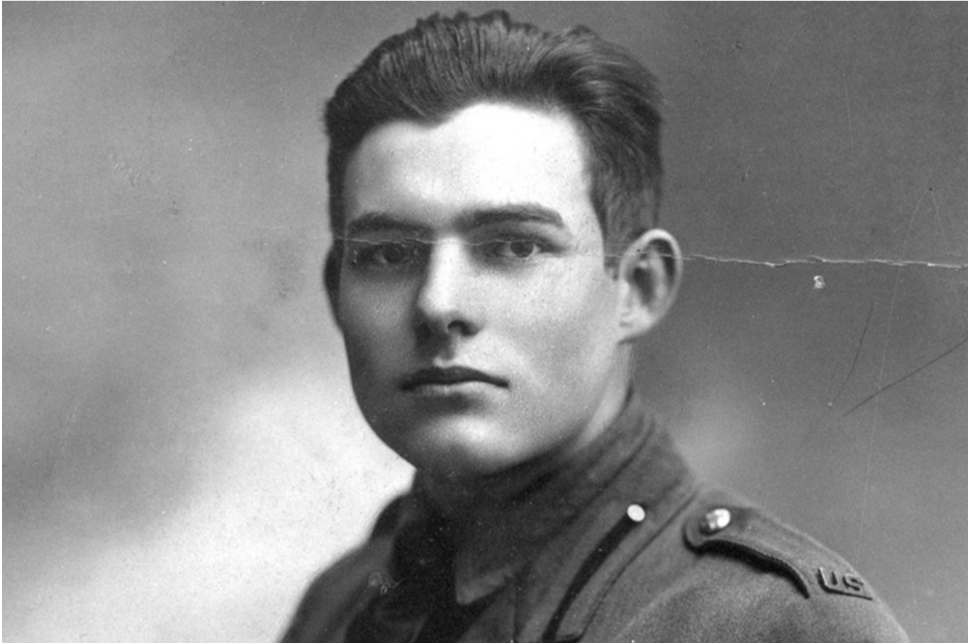
Il giovane Hemingway in uniforme, 1918

Per di più, non riusciamo ad abbandonare una volta vecchi tabù. Prendiamo la questione territoriale , che è la causa scatenante di una infinità di battaglie e di guerre per la delimitazione dei confini. Non c'è bisogno di esperti per capire che la divisione territoriale del 1947 imposta nel Medio Oriente, producendo una serie di enclave, avrebbe generato inadempienze e invasioni. E poi anche per l'Ucraina, dove Kiev ebbe nel Medioevo un ruolo di grande capitale di quella che poi abbiamo chiamato Russia, si devono gestire tematiche plurisecolari di invasioni e di opposte identità religiose. Ma perché dev'essere la guerra a gestirle? Se inevitabile è stata la guerra ancora più inevitabile deve risultare la pace.