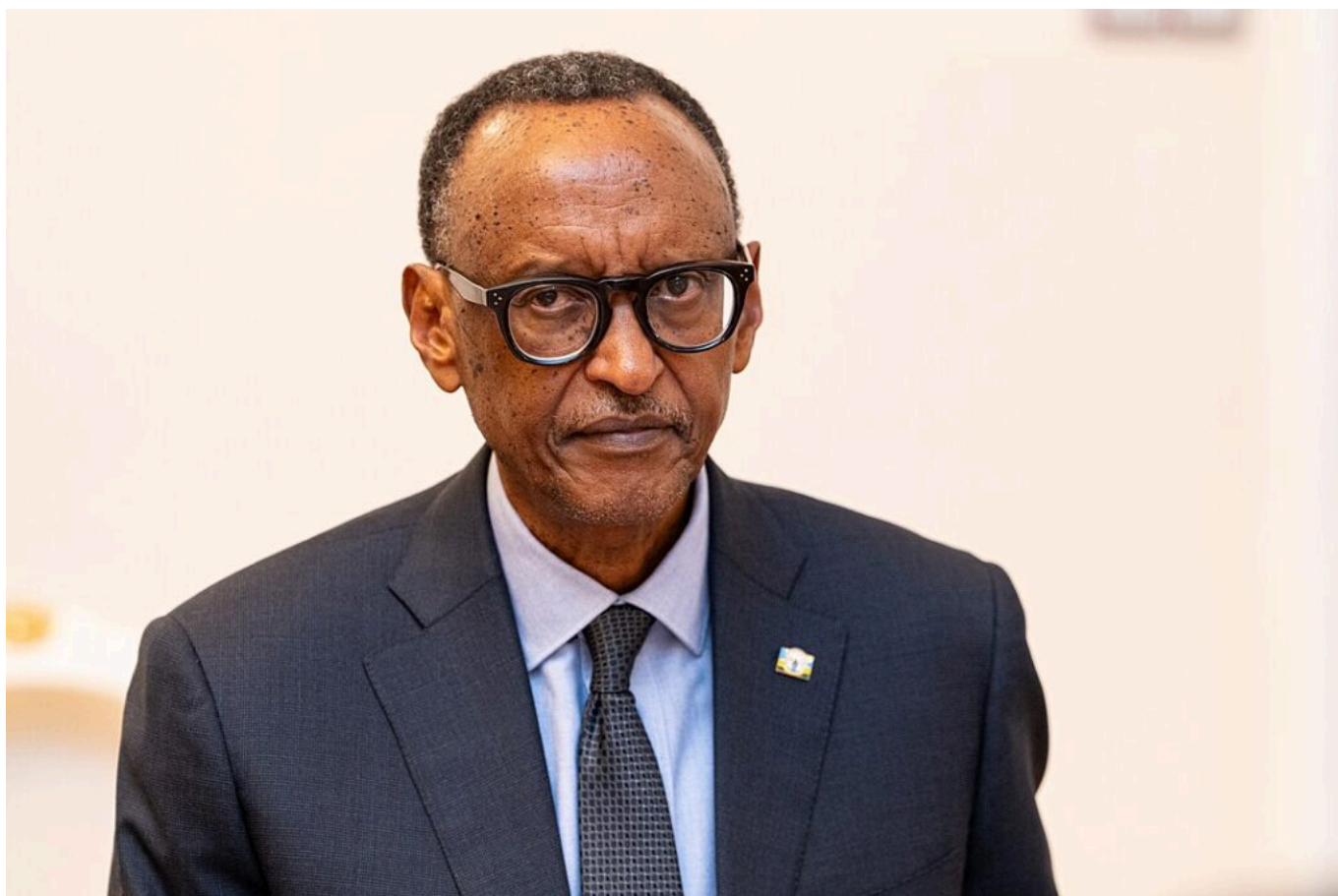
Il Presidente della Repubblica del Ruanda Paul Kagame

Fino alla scorsa settimana era la presidenza della RDC ad aver rifiutato più volte l'incontro diretto con le milizie ribelli, sostenendo che l'M23 è solamente il braccio armato di Kigali . Accusa quest'ultima sempre negata dal Ruanda di Paul Kagame, nonostante le diverse prove fornite da indagini delle Nazioni Unite e indipendenti riguardo l'appoggio logistico di Kigali ai ribelli e la presenza di almeno 5.000 effettivi ruandesi in RDC . Dall'inizio del mese sono incominciate ad arrivare le prime sanzioni internazionali nei confronti di alcuni comandanti delle milizie ribelli, ma anche e soprattutto nei confronti del Ruanda. Prima il Regno Unito ha tagliato fondi e congelato accordi con Kigali, poi gli USA hanno sanzionato alcuni esponenti politici ruandesi e infine l'UE ha sanzionato nove individui tra ribelli e funzionari ruandesi. Alla messa in pratica di queste sanzioni, lunedì il Ruanda ha tagliato i rapporti diplomatici con il Belgio , proprio quando l'AFC ha annunciato di non partecipare ai colloqui. Kigali ha intimato ai funzionari belga di abbandonare il territorio ruandese entro 48 ore, accusando Bruxelles di «voler sostenere un piano neo coloniale» e di «schierarsi sistematicamente contro il Ruanda». A seguito della decisione di Kigali non si è fatta attendere la risposta del ministro degli Esteri belga, Maxime